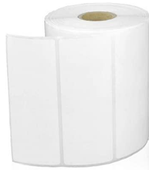
3,5 cm x 10,5 cm, tre-delt