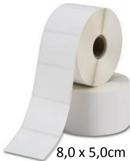
8,0 x 5,0cm